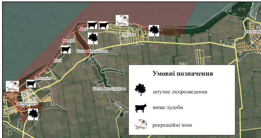
Рис. 3. Карта-схема сучасних ризиків для популяцій Lepidoptera , що охороняються на території НПП «Великий Луг»