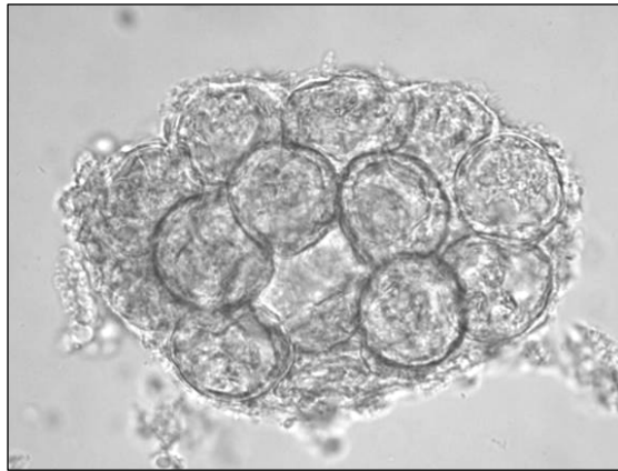
Рис. 1. Кокон із яйцями Dipylidium caninum

Цестоди представлені Dipylidium caninum (рис. 1), у якого до навколишнього середовища потрапляє зрілий членик із коконами яєць. Така особливість біології цього виду цестод (зокрема скупченість яєць у коконі) спрощує виявлення його інвазійних елементів у доквіллі. Не виключена можливість контамінації субстратів (зокрема піску та ґрунту) й іншими видами цестод. Проте за малих розмірів їх інвазійних елементів виявлення збудників ускладнене.