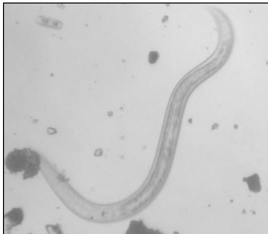
Рис. 2. Личинки Strongyloides stercoralis

Серед ідентифікованих видів у пробах ґрунту домінували Strongyloides stercoralis (рис. 2) та нематоди ряду Strongylida, зокрема Uncinaria sp.