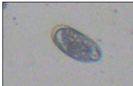
Рис. 5. Ооциста паразитичних найпростіших м'ясоїдних

Личинок S. stercoralis , яйця Uncinaria sp. , ооцисти паразитичних найпростіших Cystoisospora sp. та T. gondii (рис. 5) визначено у 33,3 % випадків.